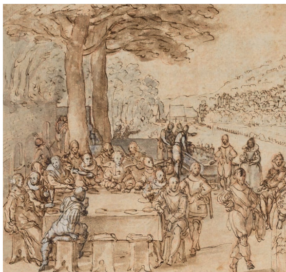
Bankett des Markgrafen Wilhelm von Baden-Baden in den Auen an der Oos, Friedrich Brentel (ca. 1630)

Eine italienische Reise aus dem Herbst der Renaissance in den Frühling des Frühbarocks